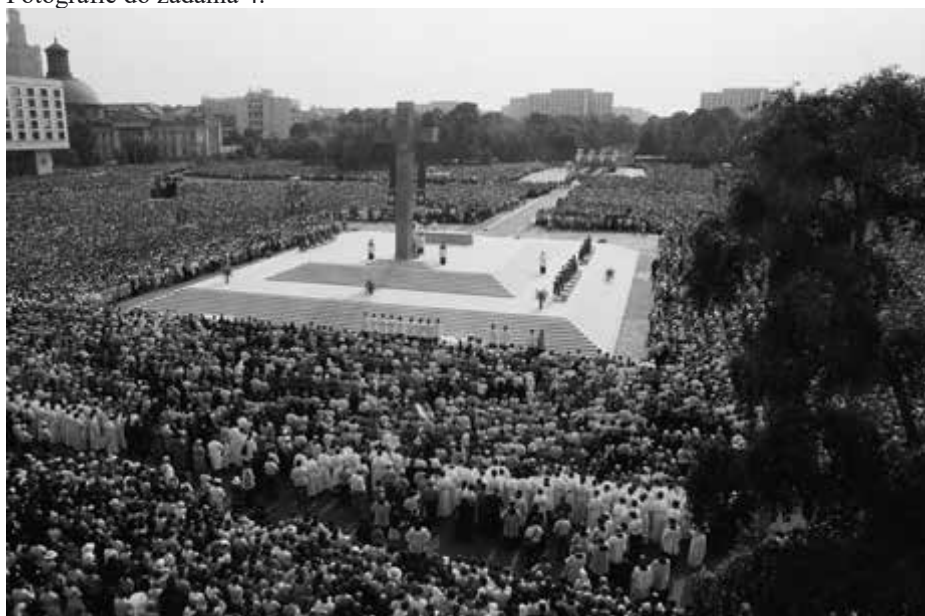
Fotografie do zadania 4.